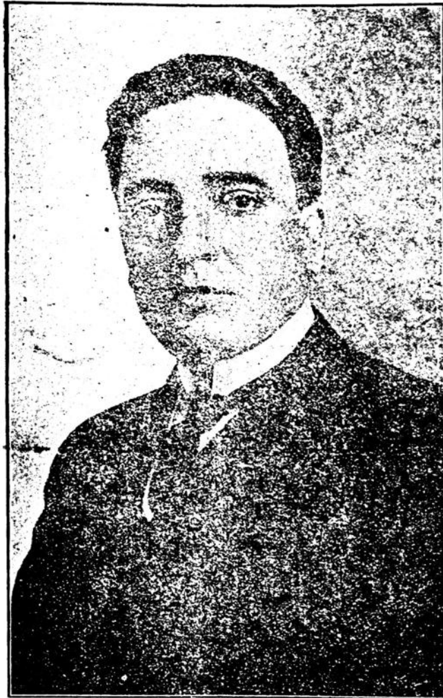
DOCTOR BALTASAR BRUN

Frente a todas esas fuerzas reaccionarias y oscuras el Batllismo, pleno de idealidades, grande y fuerte por sus humanas y nobles concepciones, soberbio en sus proyecciones y en su pureza cívica, insertando en su programa principios como estos: «El derecho a la vivienda», «A la Instrucción Pública», «La jubilación para todos los que trabajan», «El salario mínimo», «Pensiones a la vejez», «Ley de ocho horas», «Asilos Maternales», «Creación de los Médicos Seccionales», culminando, finalmente, en sus ansias de mejoramientos y su insaciable sed de justicia; en su eter-