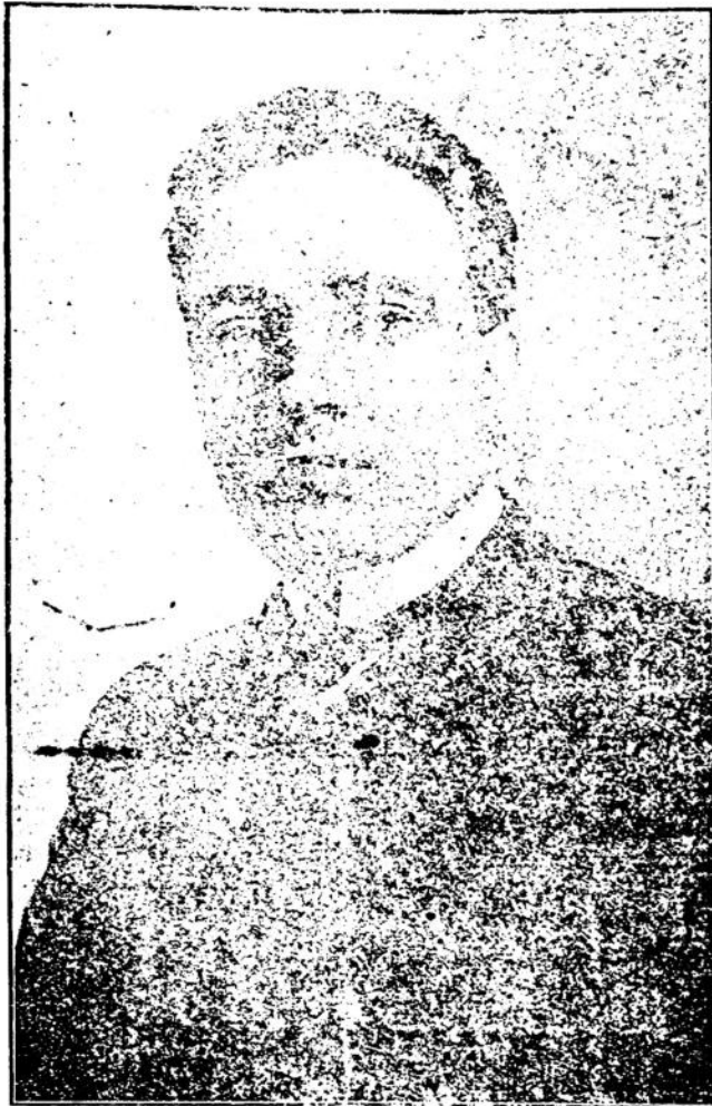
DOCTOR BALTASAR BRUN Candidato del Partido Colorado Batllista a la futura Presidencia del Consejo Nacional de Administración

Votad las listas que llevan los números 12, 13 y 14—únicas y verdaderas listas batllistas.