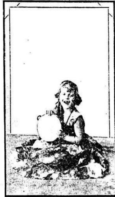
Botón de rosa y nieve que cuajó en un par de ojos preciosos y en una sonrisa encantadora y purísima, su graciosa delicadeza infantil