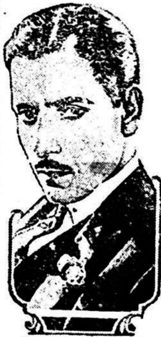
RONALD COLMAN Interprete de «Su noche de Amor»