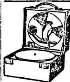
La música ideal