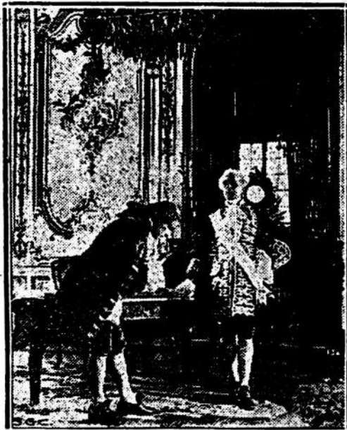
Jhon Barrymore y su esposa Dolores Costello en una apasionante escena del grandioso film Los Amores de Manón

» Los Amores de Manón — maravillosa adaptación de la obra del Abate Prevost, es la película que el Ideal nos ofrecerá en la noche del domingo