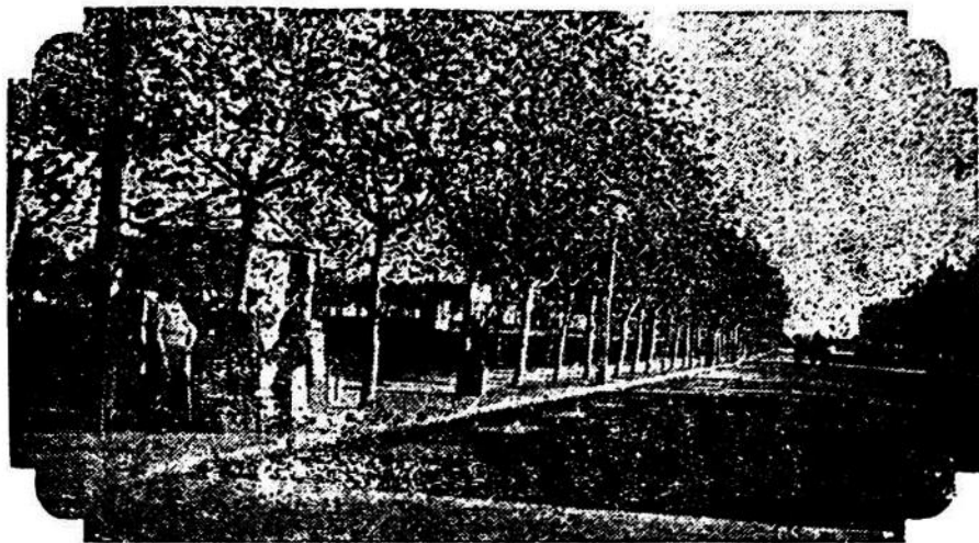
Una pintoresca vista de la Av. Artigas, donde se destaca como un centinela avanzado de la suerte, el famoso «Kiosco Blanco» que tiene en sus vidrieras el billete con los 600.000 $ de la lotería de fin de año.

ma Comisión de Fomento, la que por cuestiones personales de algunos de sus miembros, no cumple con el cometido para que fué creada. En la última fiesta ó sea la de clausura realizada el domingo 13 se despreocupó en absoluto de la Escuela, y creemos, fué la única del departamento que no hizo reparto de caramelos a los alumnos, apesar de contar con fondos.