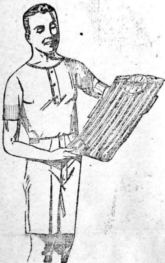
Camisas de popelina GRAN MODA en varios colores desde $ 0.75 a $ 3.50

Ropa interior en distintas telas juego desde $ 1.25 a $ 4.95