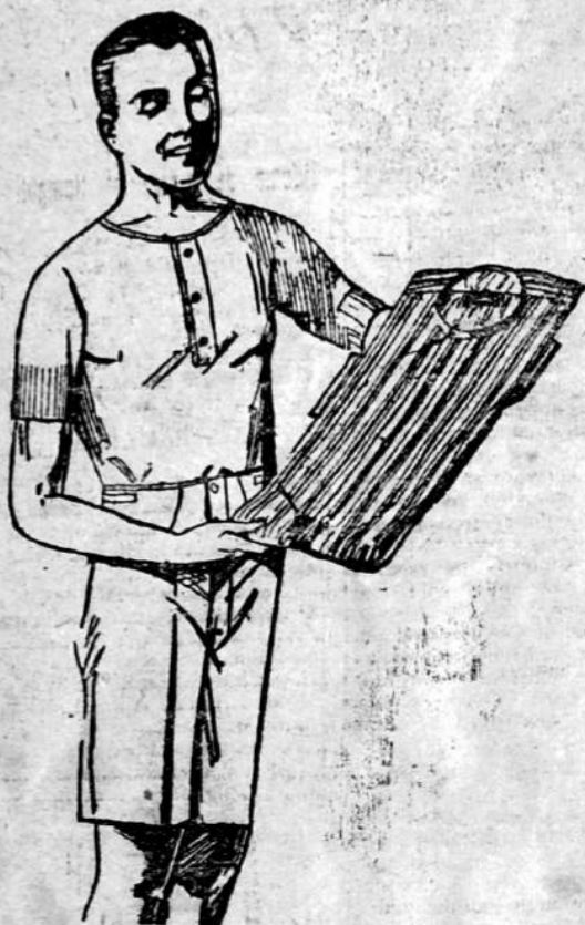
Camisas de popelina GRAN MODA en varios colores desde $ 0.75 a $ 3.50

Ropa interior en distintas telas juego desde $ 1.25 a $ 4.95