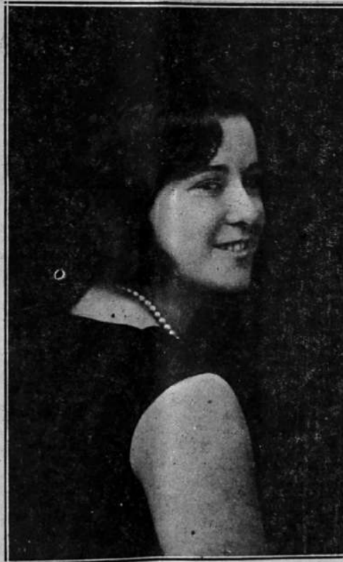
Distinguida niña que goza de grandes simpatías en la sociedad del solar.

taca la vida entre vastidores contemplada desde un punto de vista nuevo, muy al natural y con una sutileza que evita ni la ironía social ni los apasionados del amor. Algo muy atractivo, ingenioso, divertido y simpático para toda clase de públicos. Completa el programa la muy cómica en tres actos «Rey de espadas».