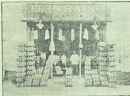
Una buena provisión de Extracto de Malta Montevideana

La extensión enorme de su consumo en continuo desarrollo y rápido aumento, es la consecuencia lógica de la bondad, ya indiscutible, de ese admirable producto, que resulta un alimento en muchos casos insustituible, y un poderoso tónico que indica con frecuencia los médicos, con plena confianza.