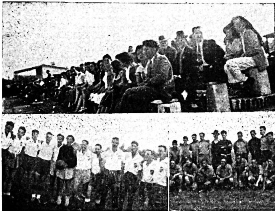
Arriba: Parte del numeroso público que colmó las instalaciones del Estadio del Parque Libertad.— Abajo: Los equipos de Nacional de Villa Sarandí del Yí y Lito de Minas, participantes del Certámen Interdepartamental Relámpago, posando para "Sporting Casupense"