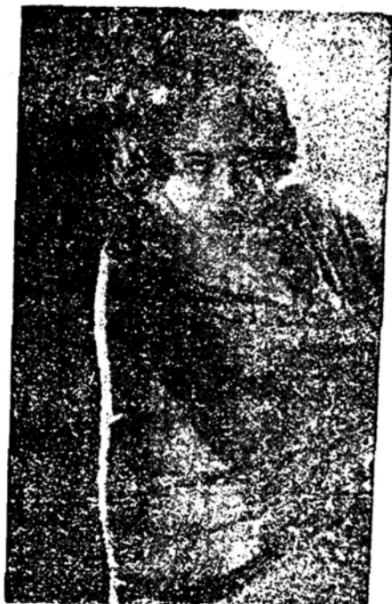
Interprete de Diablos del Cielo