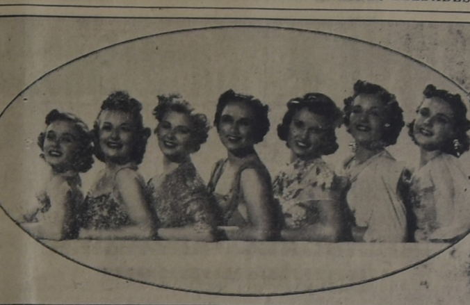
Las bellas y famosas modelos que aparecen en la producción de Walter Wanger, "Modas y Bellezas de 1938". Distribuida por United Artists.

Vamos a hablarles del modelo más perfecto del mundo, tan perfecto que ningún artista que solo ha sido posible crearlo en el ámbito de la imaginación con los datos suministrados por 128 de los más destacados modelos del orbe.