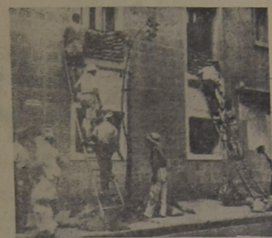
Constantemente los ciudadanos chinos ven interrumpido su sueño por el estallido de bombas que dejan siempre un saldo trágico. Como es natural, las autoridades han tomado medidas para disminuir en lo posible el peligro. El grabado muestra un refugio nocturno en cuya ventana se están colocando pilas de bolsas de arena.

El destino de los tres será re-velado en breve, y el melicón correspondiente a los algunos años de cárcel, pocas probabilidades tienen Hope y James de librarse a la vida eléctrica.