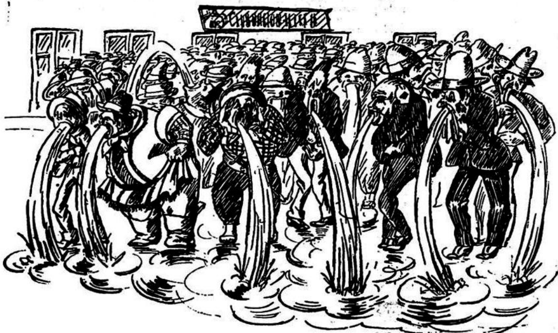
Fotografados históricos: «La cerviz de la victoria».—Bajo este título publicamos, algunos días después de las elecciones últimas, este sugestivo dibujo de nuestro caustico colaborador gráfico Cirilo. Por él se comprobó como es ya la manía ciliata de celebrar victorias... a los y después de sus reiteradas derrotas.