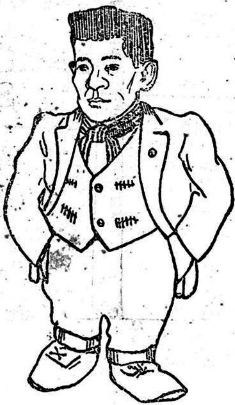
Boxeador y centre-forward de los aurinegros

nunjo tienen su inocente, Florida por no ser menos, también lo tiene: Frutos.