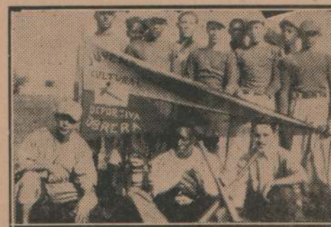
Team de football de la Juventud Cultural y Deportiva Obrera de Cuba

El hecho de estar "estrictamente prohibido tratar cues-