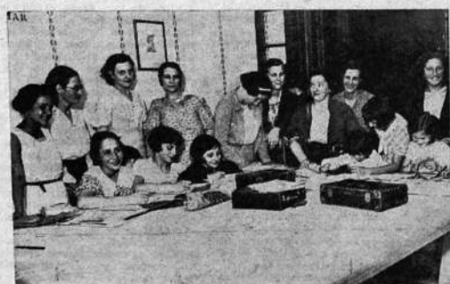
UN GRUPO DE "CORTE Y CONFECCION"