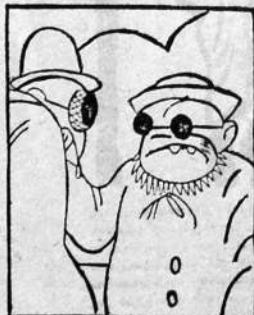
—Nuestro triunfo es seguro si nos unimos. —No; nuestra derrota es segura si ellos se unen.