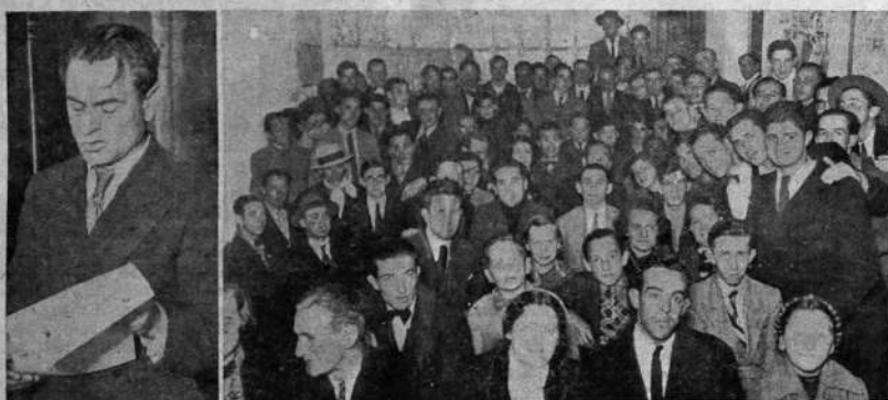
Estable dictando su magnífica conferencia