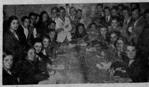
UNA CLASE FUNCIONANDO