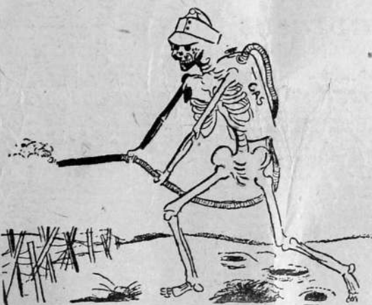
Cuanto más cruel, tanto más humano