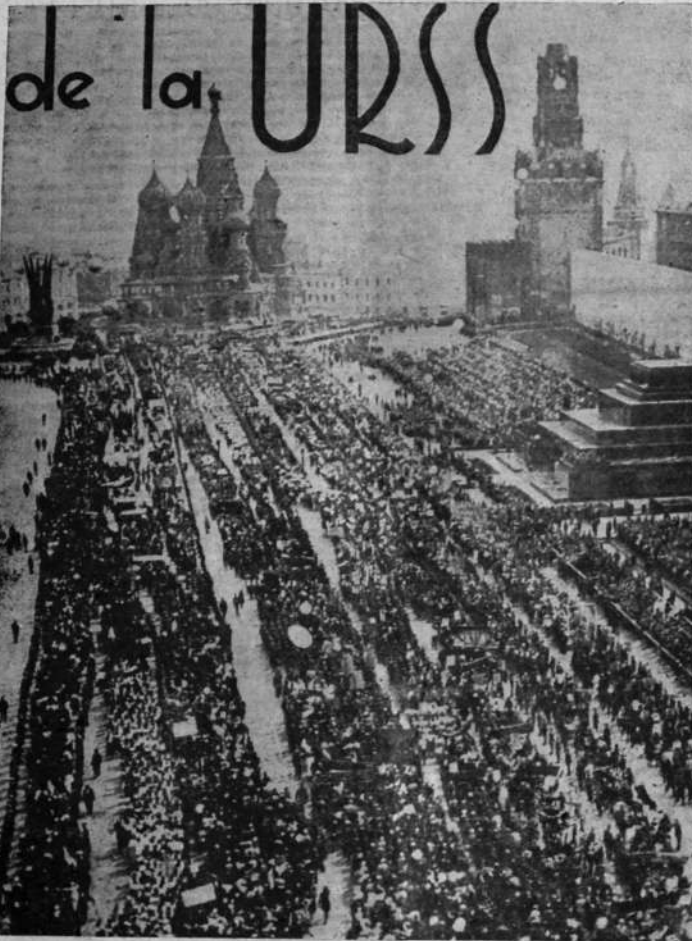
UN DESFILE EL 7 DE NOVIEMBRE

En la Rusia zarista no había arriba de 850 diarios con un tiraje de 2.700.000 ejemplares. Hoy día, no existe una sola la región que no tenga un diario. Pueblos que no tenían idioma escrito antes de la revolución editan hoy día diarios y libros en su lengua materna. Se publican diarios en las aldeas, en todas las usinas y talleres, en las estaciones de máquinas agrícolas y