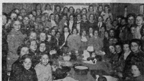
GRUPO DEL CURSO DE "SOMBREEROS", EN PLENA TAREA

tomaremos la Universidad Popular "Florencio Sánchez" como modelo por ser la que más conocemos.