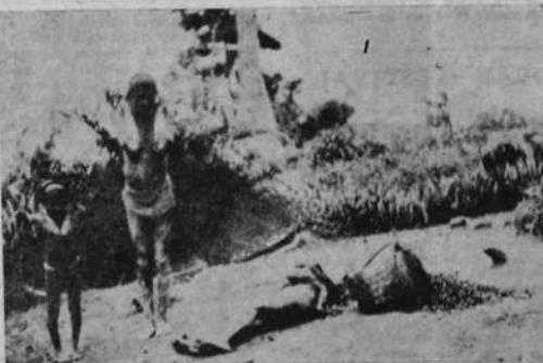
Una de las pobres mujeres negras, esclavizadas en el transporte, encuentra la muerte en el camino.

En veinte años, una población de 7 millones y medio, ha quedado reducida a 2 millones y medio, mientras que la población del Gabón, que era de 1 millón y medio, no es hoy