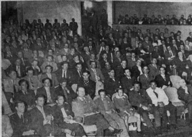
La numerosísima asamblea del Albéniz, que condenó el proyecto de que es autor César G. Gutiérrez, Ministro de Industrias, defensor del proyecto y accionista de las empresas monopolizadoras a la vez.

Los productores de leche realizan energéticos actos de protesta contra la sanción del proyecto monopolizador de la leche