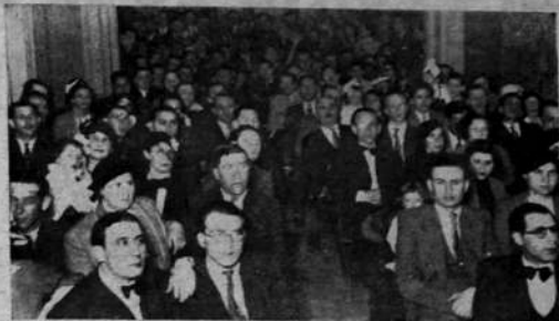
La concurrencia en el acto de fundación del Club Popular Israelita

Como los opositores saben que trabajando por el frente popular, la redoblona no se hace, y están en ello cada vez con más entusiasmo; sólo quedan los amigos de la situación para hacer las "escaleras" de la quiniela presidencial.