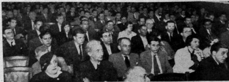
Una vista del acto realizado por el Partido Socialista