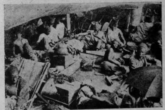
El aparato de represión. Tiradores senegaleses y sus mujeres, a bordo de un transporte sobre el río Níger.

restante. En Kenya, 12 mil colonos blancos tienen 15 mil hectáreas de tierras. En África del Sur, el 80 o/o de las tierras óptimas es para la agricultura de los blancos, mientras que a 2 millones de negros, sólo se les han dejado 18 hectáreas de malas tierras. Así, pesan sobre el negro tantas obligaciones, que para poder pagarlos, aún cuando tenga alguna tierra, tiene que trabajar por un salario miserable, en tierras de blancos durante gran parte del año.