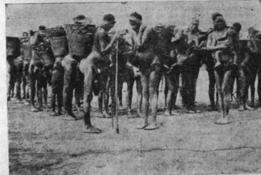
El transporte forzado de los productos indígenas es causa de hondas tragedias. He aquí un grupo de mujeres de Balú, unas en cinta, otras con sus hijos a cuestas, obligadas a recorrer 200 kilómetros con 40 kilos de carga hasta el mercado obligatorio (Diondo).

merún, Angola, Niger. Por donde pasa el blanco, deja la muerte tras sí.