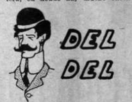
Aneédotas deportivas, por Tressados

El adversario que le deparó el fustero, no es de los que se amilan ante la superioridad rival. Es Central un team entusiasta al extremo y tiene elementos que conocen muy bien el arte de manejar el balón, especialmente su línea delantera, en donde hay mucho enten-