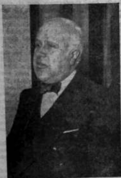
El leader socialista habla para LIBERTAD

—Concretándonos al movimiento motivado por el Proyecto del P. E., puede manifestar que resulta reconstituyente para el espíritu nacional, la actitud asumida por la inmensa