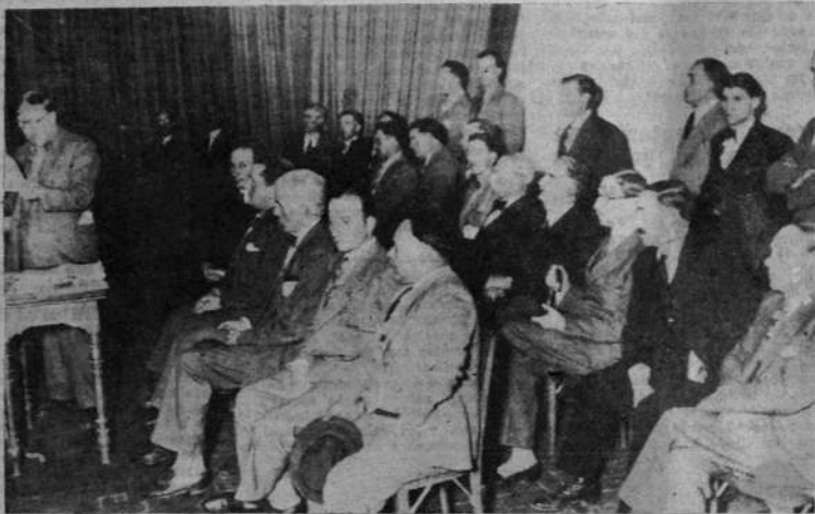
LA MESA QUE PRESIDIO EL ACTO