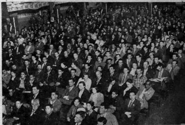
La numerosa concurrencia en la conferencia organizada por el Partido Comunista