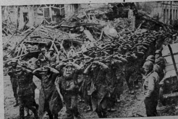
Custodiados por soldados de los Estados Unidos una columna de prisioneros nazis, con las manos sobre la cabeza, pasan por una aldea alemana. Los cuadros como este deben hacer evidente al pueblo alemán que es incontestable el hecho de que Alemania ha sido invadida y que su ejército ha sido derrotado.