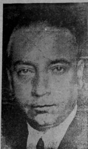
Dió su Vida por la Libertad