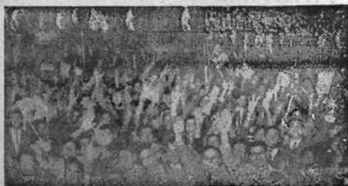
Columna de la Juventud Batllista