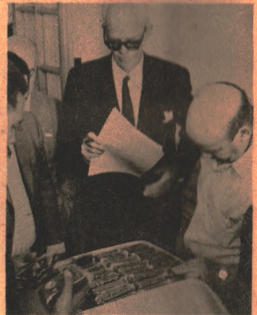
Autoridades aduaneras examinando las valiosas mercancías que se intentaba pasar con un permiso adulterado.

Tan vasta cadena de maniobras, ha venido a descubrirse, porque al intentar repetir el manejo de doble permiso, para introducir sin pagar derechos,