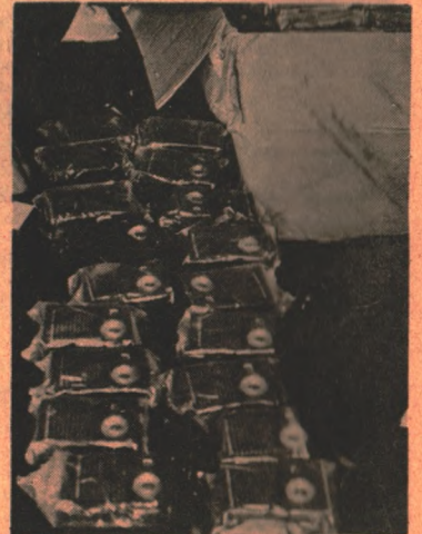
Esto, según el permiso fraudado, era "mercancía sin valor". Decenas de radios a transistores amontonadas dentro de una gran caja.