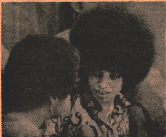
Angela Davis conversa con su abogado.