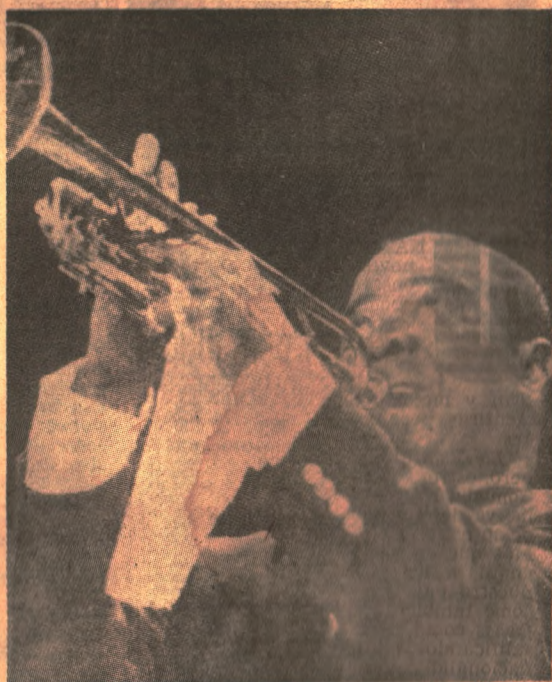
Armstrong y su trompeta: una imagen inmortal.

teideo luego de una exitosa gira por América Latina. "Siempre es demasiado temprano para morir" afirmó en aquella memorable ocasión a los periodistas montevidenses.