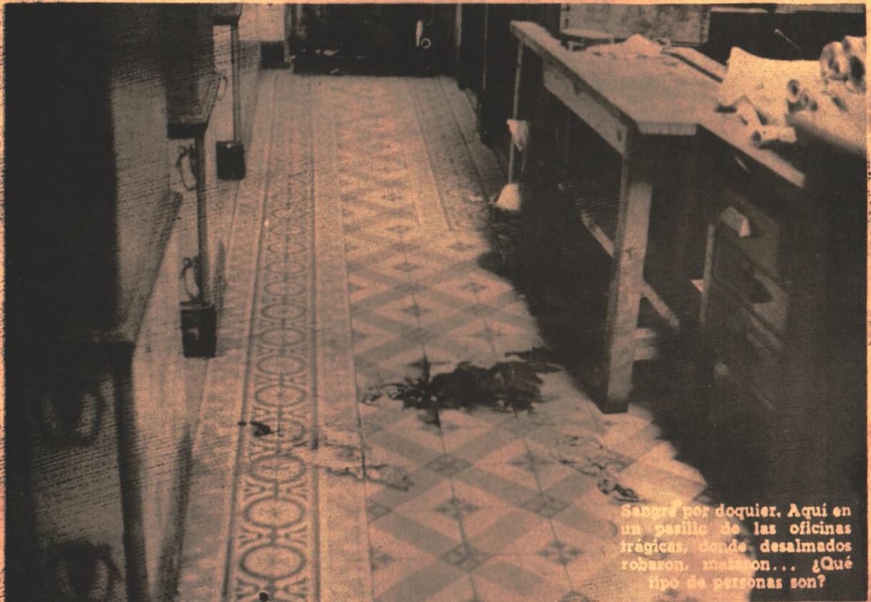
Sangre por doquier. Aquí en un pasillo de las oficinas trágicas, donde desalmados robaron, mataron... ¿Qué tipo de personas son?