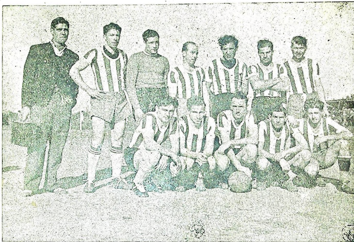
Que conquistó en propiedad la Copa de la Liga Carmelana de Football