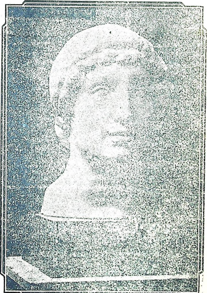
Cabeza de Estudio