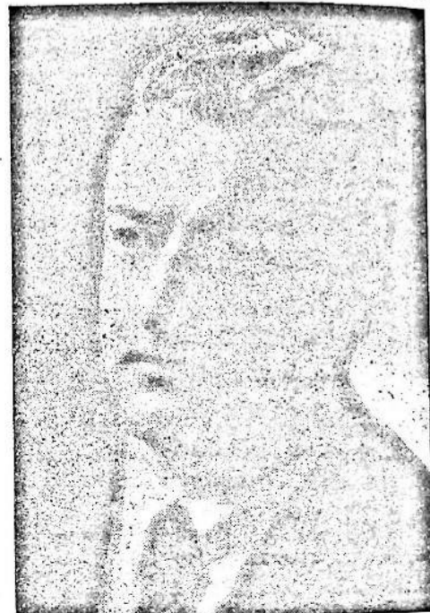
CANDIDATO DEL PUEBLO DE TACUAREMBO A LA REPRESENTACION NACIONAL