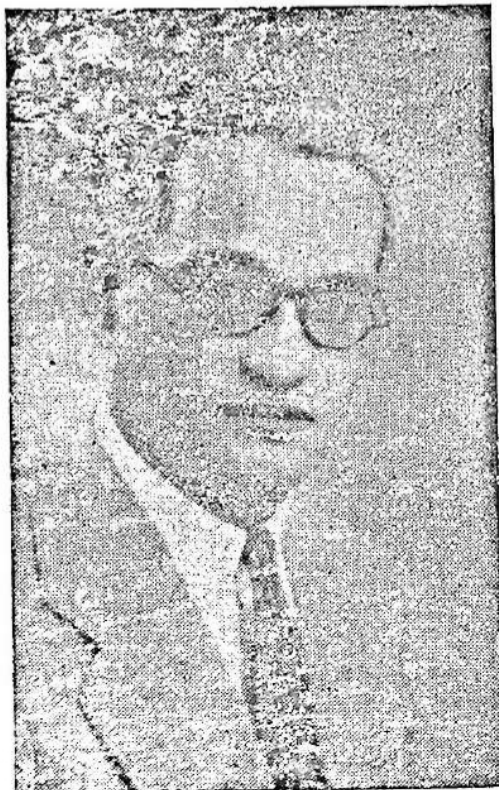
CANDIDATO DEL PUEBLO DE TACUAREMBO AL CONCEJO DEPARTAMENTAL Y A LA INTENDENCIA MUNICIPAL