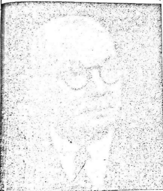
Figura de singulares relieves morales y partidarios, cuya incorporación al Parlamento Nacional, en representación del Batllismo montevideano, aportará a la solución de los graves problemas políticos y económicos que afronta el País, el concurso de uno de los criterios más sólidos y mejor informados sobre nuestras realidades, al par que en espíritu profundamente democrático.