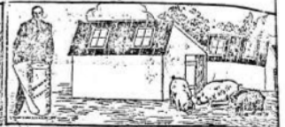
PARA CHIQUEROS, GALLINEROS, ETC.

Enviamos, a solicitud, muestras de los diferentes tipos, instrucciones para su colocación, precios y demás detalles de interés.