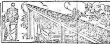
PARA EL GALPÓN