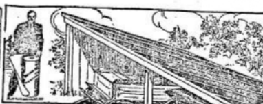
PARA EL GALPON