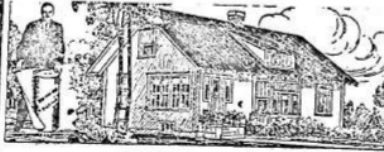
PARA LA HABITACION

Al principio, hace ya muchos años, cuando iniciamos la importaci6n de este techado, los interesados lo compraban como para hacer experimentos. Hoy, que los años y la práctica lo han consagrado como el techo ideal para toda clase de construcciones, sin excepción, su uso se ha generalizado a tal punto que muchas veces la demanda supera la importaci6n. Y si el artículo no fuera de primer orden, no lo venderíamos nosotros.