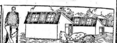
PARA CHIQUEROS, GALLINEROS, ETC.

Enviamos, a solicitud, muestras de los diferentes tipos, instrucciones para su colocación, precios y demás detalles de interés.