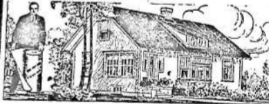
PARA LA HABITACION

Al principio, hace ya muchos años, cuando iniciamos la importación de este techado, los interesados lo compraban como para hacer experimentos. Hoy, que los años y la práctica lo han consagrado como el techo ideal para toda clase de construcciones, sin excepción, su uso se ha generalizado a tal punto que muchas veces la demanda supera la importación. Y si el artículo no fuera de primer orden, no lo venderíamos nosotros.