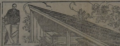
PARA EL GALPÓN