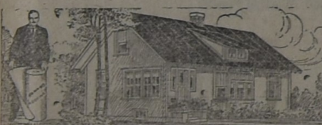
PARA LA HABITACIÓN

AL principio, hace ya muchos años, cuando iniciamos la importación de este techado, los interesados lo compraban como para hacer experimentos. Hoy, que los años y la práctica lo han consagrado como el techo ideal para toda clase de construcciones, sin excepción, su uso se ha generalizado a tal punto que muchas veces la demanda supera la importación. Y si el artículo no fuera de primer orden, no lo venderíamos nosotros.