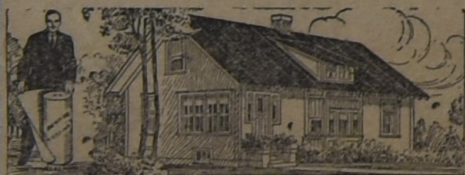
PARA LA HABITACIÓN

AL principio, hace ya muchos años, cuando iniciamos la importación de este techado, los interesados lo compraban como para hacer experimentos. Hoy, que los años y la práctica lo han consagrado como el techo ideal para toda clase de construcciones, sin excepción, su uso se ha generalizado a tal punto que muchas veces la demanda supera la importación. Y si el artículo no fuera de primer orden, no lo venderíamos nosotros.