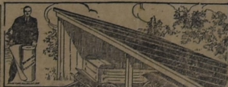
PARA EL GALPÓN