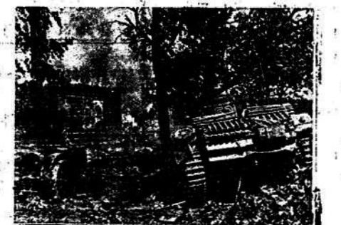
TANQUE ALEMÁN LUCHA CONTRA LOS RESTOS DE UN FORTIN SOVIETICO.