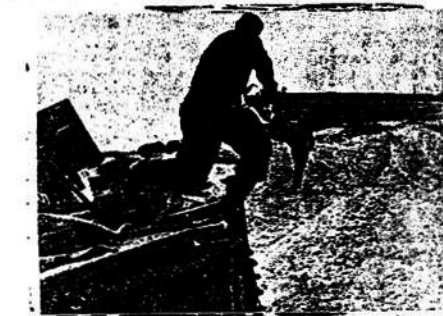
Después del fracaso de un tanque de los tanques soviéticos, la tripulación de un tanque alemán se baja para recibir a los prisioneros de los tanques soviéticos.—