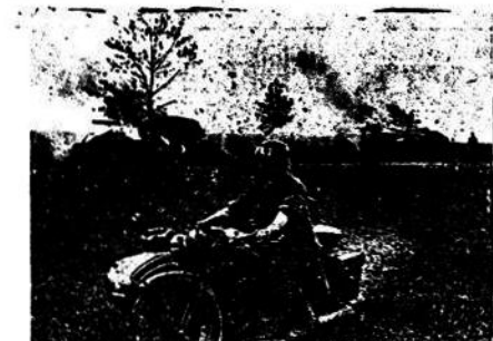
Completamente aniquilados quedan los tanques soviéticos al borde de las carreteras.—El ataque ha sido impedido y las columnas alemanas siguen su marcha.

EN MONTEVIDEO: Mercedes 758 Esq. Florida - Telé. 915-77 - 915-78