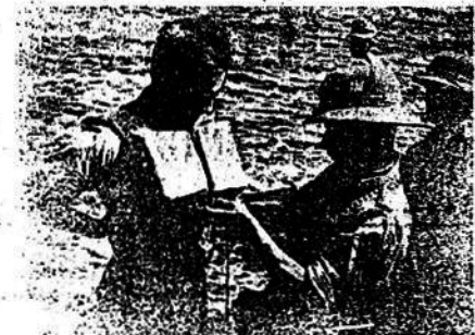
Para las tropas alemanas la camaradería está sobre todo. Aquí vemos tropas alemanas ayudando a los miembros ingleses de un barco de municiones a quitarse los salvavidas, después de haber sido hundido el buque.

Quizás, y siempre dentro del terreno de las posibilidades, esta se haga desde lejos y a buen