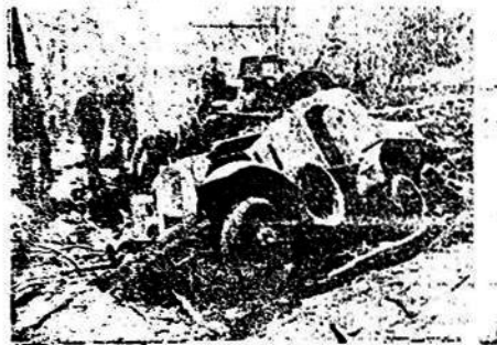
El general Antonescu revisa un tanque soviético destruido en el frente de Besarabia.

Los envíos bélicos de la Unión a Rusia vía Siberia, son considerados por el Japón como una amenaza directa a su posición predominante en el Lejano Oriente, ya que no ha obtenido la seguridad de que tales pertrechos de guerra serán enviados ciertamente a la parte europea de Rusia. Su lógica preocupación es que ellos sirven contrariamente, a fortalecer la posición de los ejércitos rusos en Siberia, uno de los tantos eslabones del cerco anglo-yanqui contra el Japón.—Los días venideros darán fisonomía más clara a la situación en el extremo Oriente. Entretanto se ha producido la décima entrevista Hitler-Mussolini, realizada esta vez en pleno teatro de guerra, en el cuartel general del Fuehrer. Las entrevistas de estos dos jefes de estado, han sido siempre presagio de acontecimientos trascendentales y decisivos, ya que nunca se diluyeron en declaraciones emulamente platónicas, cosa que los hechos han confirmado una y otra vez, tal aseveración.—(Transocean).