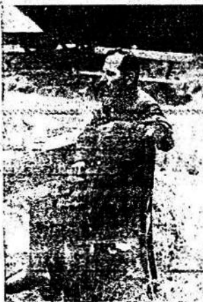
GENERAL DE EJERCITO SOVIETICO CA. DO PRISIONERO EN MANOS ALEMANAS

Se cita a las señoras y señoritas integrantes de este Comité para la reunión que con el fin de tratar importantes asuntos, que no pueden ser postergados, se efectuará el día SÁBADO 20 del corriente a las 16.30 horas, en la Casa del Partido, Independencia 731.—LAS SECRETARIAS.