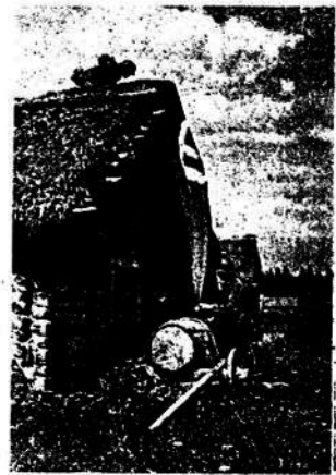
OTRO PUEBLO SOVIETICO CAYO EN PODER DE LAS TROPAS ALEMANAS. INMEDIATAMENTE ES COLOCADA LA BANDERA DEL REICH.