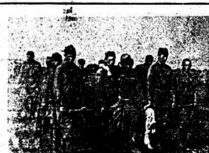
PRISIONEROS SOVIETICOS MARCHAN HACIA UN CAMPAMENTO. ENTRE ELLOS SE ENCUENTRAN ALGUNOS HERIDOS.