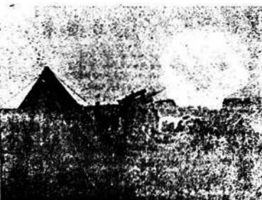
Batería antiaérea alemana en plena actividad durante un combate nocturno.