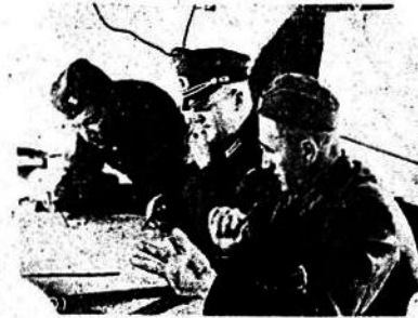
El Comandante de la división Slavova en el frente este durante una conferencia con sus oficiales.