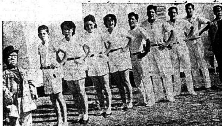
Conjunto de Artistas del Circo Pensado que el próximo viernes debutará en nuestra ciudad