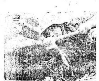
Infantes alemanes que chocaron con una fuerte resistencia roja, se cavan rápidamente una pequeña trinchera.