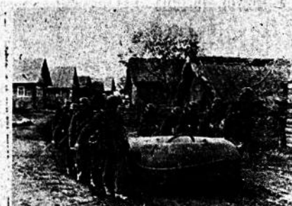
LUCHA EN EL ESTE.—Infantes alemanes llevan un bote neumático hacia el río Polist, para cruzarlo y continuar el avance.—