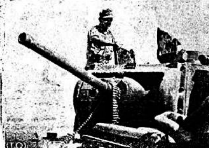
Enorme tanque inglés, tipo "Mark II" no pudo resistir al ataque alemán, durante los ataques en Sollum,—quedando casi completamente destruido.—