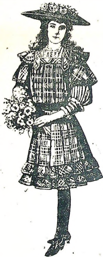
1. Vestido de verano con cortas mangas abiertas y blusa de tela diferente para niñas de 10-12 años (véase esp. grab. 1a).

1.º Vestido de primavera con cortas mangas abiertas y blusa de