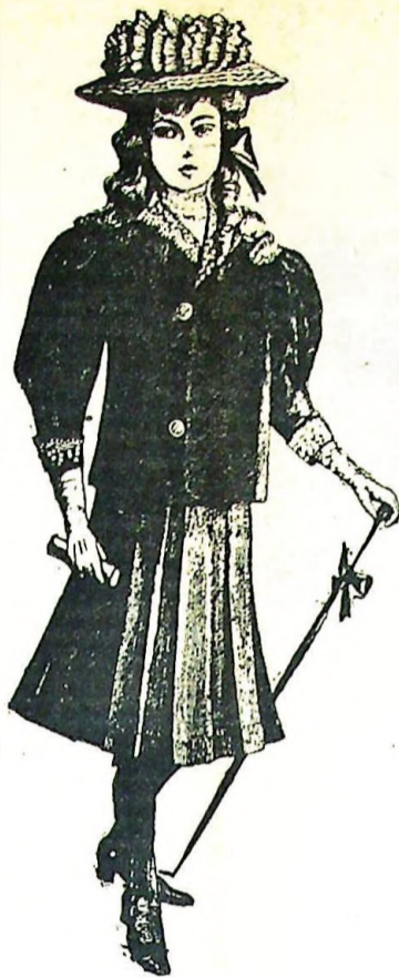
2. Vestido elegante; falda con tirantes, blusa con bordado "smock" y corto abrigo de terciopelo para niñas de 10 á 12 años (véase esp. grab. 2a, 2b y 2c).

2.º Vestido elegante; falda con tirantes, blusa con bordado "smock".