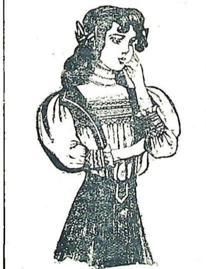
2b. Falda con tirantes y blusa de grab. 2 (véase esp. grab. 2c).

más tiene forma de saco. Encaje irlandés (imitación) color amarillo tostado cubre las vueltas de cuello y mangas; dos hileras de grandes botones fantasía, que figuran también en espalda y puños. La falda sin forro está dispuesta en pliegues de 6 cm. de ancho arriba pespunteadas.