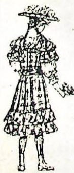
1a. Espalda de grabado 1.º El cinturón que abrocha delante bajo el lazo, es de

tela diferente, para niñas de 10 á 12 años (véase grabado 1.º) Matiné para el vestido 4 3/4 metro de tela de 75 centímetros de ancho; para la blusa 1 metro 20 cts. de tela de 90 centímetros de ancho, 2 metros de cinta, 60 centímetros de entre-dos, 60 centímetros de puntilla. El gracioso vestido de cuadros escoceses; blusa de batista blanca rayada y calada. Estrecho entredos y puntilla adecuada adornan el escote de la blusa, algunos botones de nácar