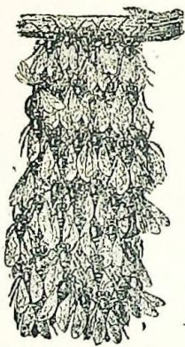
Enjambre de abejas

Luego el aire está como oscurecido. Por fin este enjambre se dirige poco á poco hacia un árbol, sobre una de cuyas ramas se para formando un montón, como un racimo: