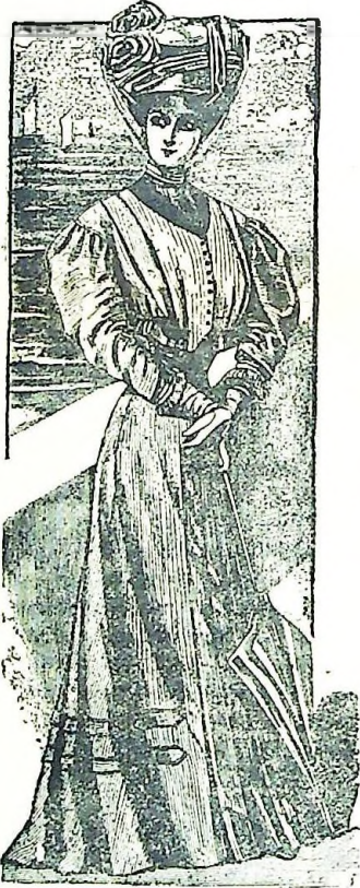
22. Vestido con bolero simulado

A ellas, pues, dedicamos esta paginita de preferencia, en la seguridad de que alhagamos sus sentimientos exquisitos: