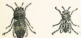
Abeja obrera Zángano

Todo el trabajo de la colmena lo verifican las obreras, las que, durante los quince primeros días de existencia cuidan la simiente y elaboran sus celdas, pasando luego á recolectoras, empezando sus correrías para recoger polen.