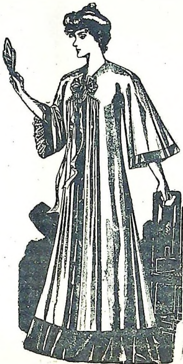
23. Bata con mangas japonesas

jo fruncidos. Un biés sujeta la espalda al forro. La manga, cortada con mangas horizontales, está plegada en la costura interior.