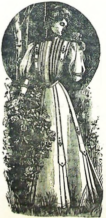
24. Sencillo vestido lavable

23. Bata con mangas japonesas. Mat. 6 1/2 m. de tela de 100 cm. de ancho, 1 3/4 m. de seda, 2 1/2 m. de puntilla, 1 3/4 m. de cinta. Nuestro modelo, tan elegante como ligero, se hizo de fino género de lana color crema combinado con seda reseda claro, cinta de seda crema de 6 y 10 centímetros de ancho y ancha puntilla de tul crema. Cierra oculto delante. En ambos picos del canesú se festoneó un ojal redondo para disponer la cinta ancha en lazadas y dar paso a la estrecha que se anuda al vestir. La puntilla en las mangas se frunce.