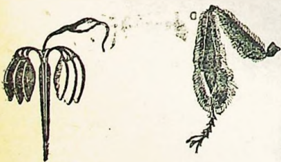
Aguijón de abeja obrera Paleta de abeja obrera

Los machos no trabajan ni recojen polen; pero son necesarios para la fecundación de la reina. Una vez verificada ésta son expulsados de la colmena por las abejas, que matan á muchos de ellos, valiéndose de sus aguijones.