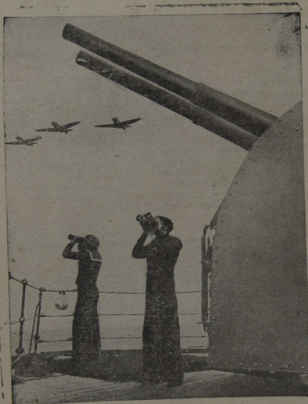
Cañones, aeroplanos y ojos avisoros guardan a los convoyes a través de los mares, cuidando que lleguen a salvo a los puertos a que son destinados.