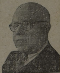
Dr Emilio Frugoni

Una numerosísima concurrencia, que al promediar el acto ya colmaba el precitado salón, asistió, con una atención no siempre tan evidente, a oír el autorizado y robusto verbo democrático del Doctor Frugoni, que una a su sinceridad una claridad de conceptos y una valentía poco común para decir las cosas, y esa concurrencia, salió completa-