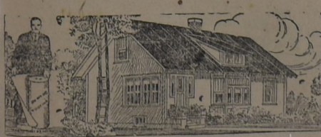
PARA LA HABITACIÓN

AL principio, hace ya muchos años, cuando iniciamos la importación de este techado, los interesados lo compraban como para hacer experimentos. Hoy, que los años y la práctica lo han consagrado como el techo ideal para toda clase de construcciones, sin excepción, su uso se ha generalizado a tal punto que muchas veces la demanda supera la importación. Y si el artículo no fuera de primer orden, no lo venderíamos nosotros.