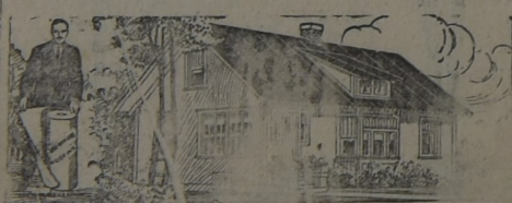
PARA LA HABITACION

AL principio, hace ya muchos años, cuando iniciamos la importación de este techado, los interesados lo compraban como para hacer experimentos. Hoy, que los años y la práctica lo han consagrado como el techo ideal para toda clase de construcciones, sin excepción, su uso se ha generalizado a tal punto que muchas veces la demanda supera la importación. Y si el artículo no fuera de primer orden, no lo venderíamos nosotros.