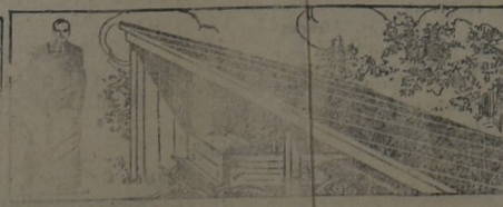
PARA EL GALPON