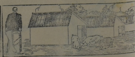
PARA CHIQUEROS, GALLINEROS, ETC.

Enviamos a solicitud diferentes tipos ción, precios y