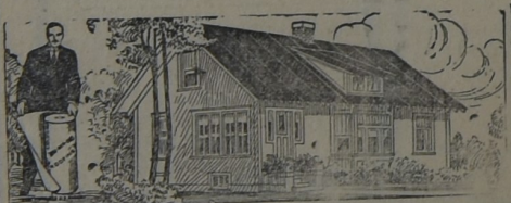
PARA LA HABITACION

AL principio, hace ya muchos años, cuando iniciamos la importación de este techado, los interesados lo compraban como para hacer experimentos. Hoy, que los años y la práctica lo han consagrado como el techo ideal para toda clase de construcciones, sin excepción, su uso se ha generalizado a tal punto que muchas veces la demanda supera la importación. Y si el artículo no fuera de primer orden, no lo venderíamos nosotros.