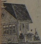
RA LA HABITACION

LOS PRINCIPALES COMERCIOS DEL RAMO LLEVAN SIEMPRE EXISTENCIA DEL RUBEROID