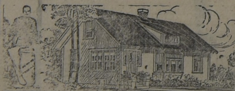
PARA LA HABITACION

Al principio, hace ya muchos años, cuando iniciamos la importación de este techado, los interesados lo compraban como para hacer experimentos. Hoy, que los años y la práctica lo han consagrado como el techo ideal para toda clase de construcciones, sin excepción, su uso se ha generalizado a tal punto que muchas veces la demanda supera la importación. Y si el artículo no fuera de primer orden, no lo venderíamos nosotros.