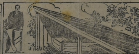
PARA EL GALPON